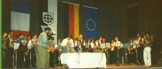
Offizielle Unterzeichnung der Verträge 1991

Der Partnerschaftsverein wurde 1988 gegründet. Nachdem schon viele private Kontakte entstanden waren, wurde die Gemeindepартnerschaft im Jahre 1991 auch von offizieller Seite besiegelt.