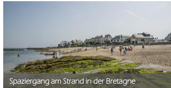
Spaziergang am Strand in der Bretagne

Lernen Sie Sitten, Gebräuche und Lebensweisen unserer Nachbarn kennen, schließen Sie neue Freundschaften und erweitern Sie Ihre Sprachkenntnisse. Wir tragen zu einer lebhaften Vereinskultur in der Gemeinde bei und fördern die deutsch-französische Freundschaft.