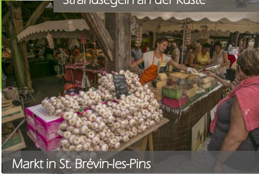
Markt in St. Brévin-les-Pins