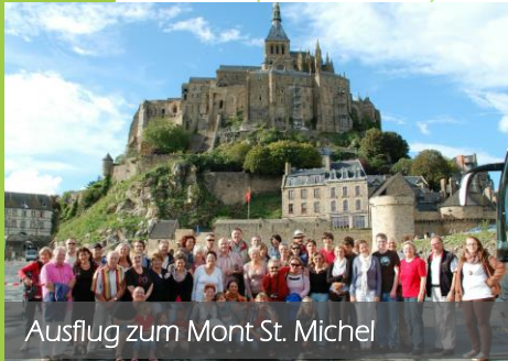
Ausflug zum Mont St. Michel