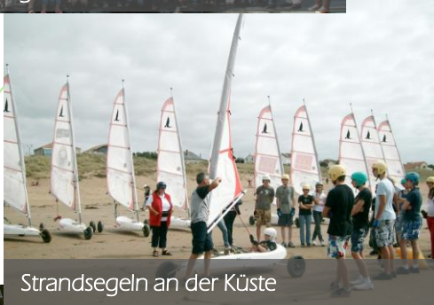
Strandsegeln an der Küste